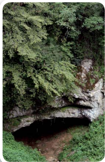
Fig. 1 Ingresso della Grotta dell'Acqua (Sant'Anna d'Alfaedo - Verona), presso il Ponte di Veja.