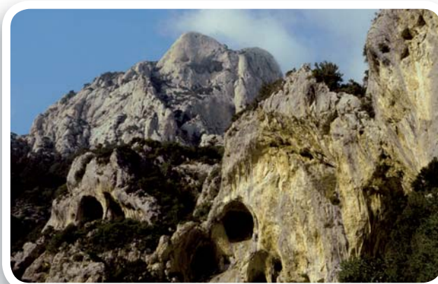
Fig. 3 Massiccio montuoso del Taigeto (Grecia); imbocchi di grotte e caverne frequentate dall'uomo in età preistorica.

ai piedi di una parete rocciosa, da quest'ultima naturalmente protetta in virtù della conformazione aggettante, in alto, della roccia stessa. Grotte, caverne e ripari sotto roccia, in quanto ambienti sotterranei di origine naturale, non vanno confusi