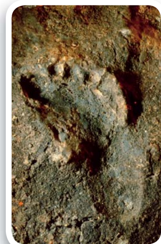
Fig. 2 Impronta di piede umano su argilla molle dalla Grotta della Basura (Toirano - Imperia), risalente al Paleolitico superiore.

Prima di tutto, però, è necessario fare qualche precisazione. Infatti, sebbene col termine grotta si indichi nel linguaggio comune qualsiasi ambiente sotterraneo, sia esso naturale o artificiale, è opportuno specificare che le grotte cui ci riferiremo d'ora in poi sono esclusivamente cavità di