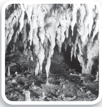
Fig. 7 Concrezioni stalattitiche lungo la diramazione che, sullo scorcio degli anni Settanta, ospiterà il percorso turistico verso un secondo ingresso artificiale (1951).