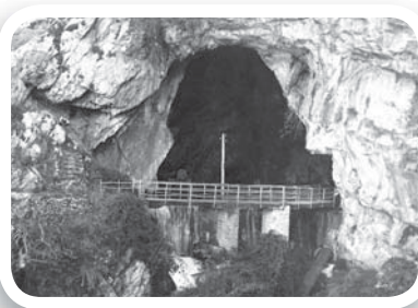
Fig. 2 L'ampio ingresso della grotta visto dall'esterno, con la diga di sbarramento delle acque eretta a fini di sfruttamento idroelettrico (1926).