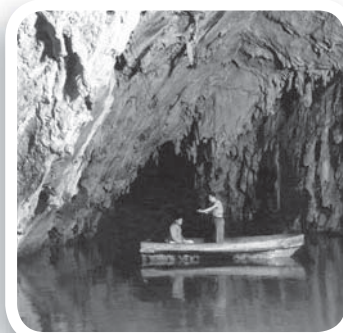
Fig. 5 Una delle barche usate negli anni Cinquanta per trasferire i turisti nei settori più interni della cavità (1951).

sino, una risorgente idrica connessa alle Grotte di Castelcivita, e la Grotta di San Michele a Sant'Angelo a Fasanelle. Negli anni 1950-1951, infine, vengono condotte nelle Grotte di Pertosa ulteriori ricognizioni da parte degli speleologi triestini. Questa volta, però, gli interessi esplorativi sono ormai del tutto assenti: i limiti della grotta sono inevitabilmente quelli raggiunti nelle precedenti esplorazioni. La presenza in