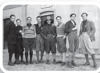
Fig. 1 I componenti della prima spedizione speleologica triestina nelle Grotte di Pertosa, ritratti a Postiglione (Salerno) nel 1926.

Figg. 1, 2, 4, 5, 6, 7: immagini tratte dagli archivi della Commissione Grotte "Eugenio Boegan" SAG-CAI. Fig. 3: da M. Trotta, Grotte della Campania , in "Le Grotte d'Italia", a. V, n° 1, gennaio-marzo 1931, pp. 17-44.