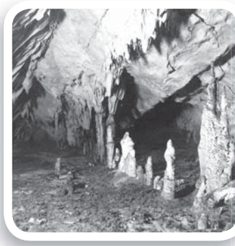
Fig. 6 Settore iniziale della condotta oggi conosciuta come "il Paradiso", breve diramazione fossile lungo il Ramo della sorgente (1951).