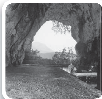
Fig. 4 L'ingresso della grotta visto dall'interno in occasione della quarta spedizione speleologica triestina (1951).